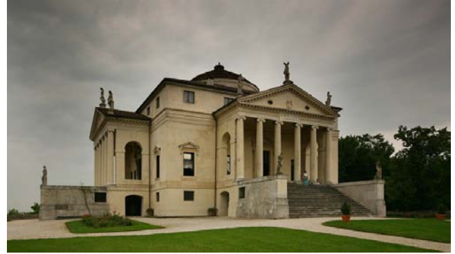
Villa Capra Rotonda

Venetischen Villen (inkl. Eintritte Villa La Rotonda und Villa Valmarana ai Nani) Dies sind alle Gebäude deren Eleganz sich